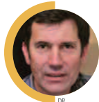
Par Ivan Best Editorialiste

multipliés par 2,4 depuis 1995 ; dans les autres pays du Nord, la hausse a été à peine moindre, alors même qu'aucune tension n'aurait dû naître sur ces marchés, puisque le stock de logements a suivi peu ou prou l'évolution de la population.