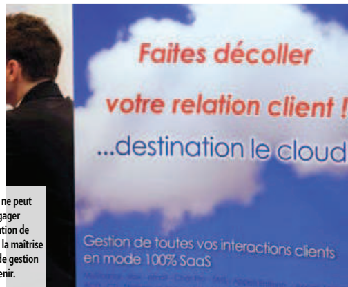
La France ne peut pas se dégager de l'obligation de conserver la maîtrise de l'outil de gestion de son avenir.